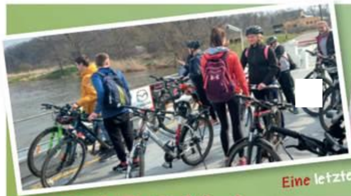
Eine letzte Radtour