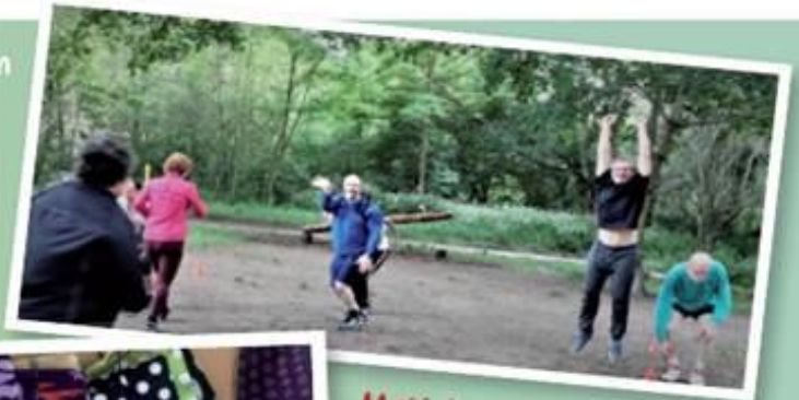
Motivierte Sportler zu Hause und ab Mai am Heidensee