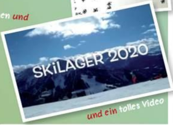
und ein tolles Video