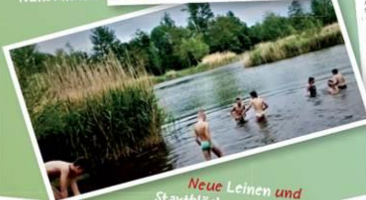
Neue Leinen und Startblöcke