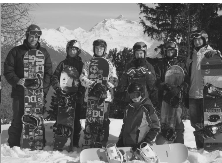
Wir freuen uns auf euch!