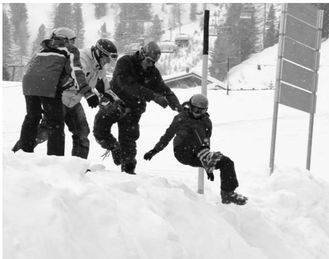
Spaß am Hang ...